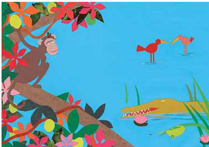
Comment Petit Singe sauva son cœur ? / conté par Bernard Chèze. - Seuil Jeunesse, 2007

Sur le principe d'un kamishibaï (livre-théâtre japonais), cette collection est idéale pour la lecture à un groupe. Il suffit de rabattre le texte vers soi pour pouvoir lire confortablement et les spectateurs profitent des grandes illustrations !